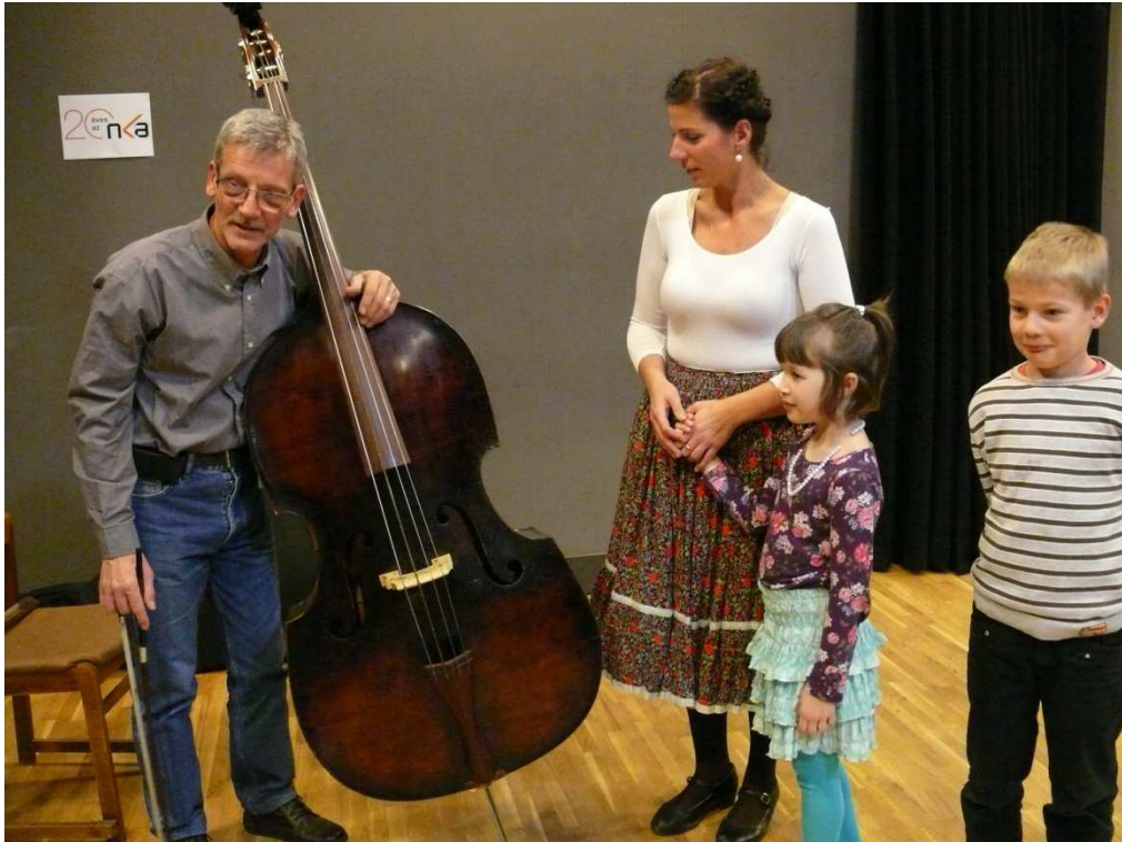
Ismerkedés a legnagyobb hangszerrel.