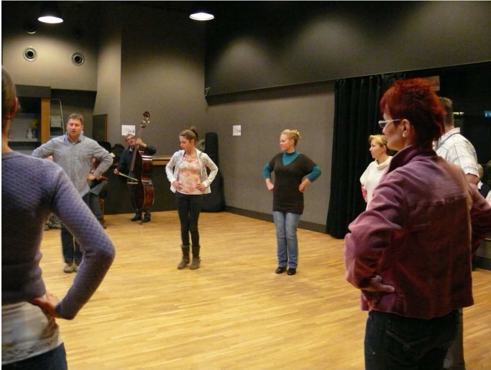
A felnőttek tánca férfi irányításával.