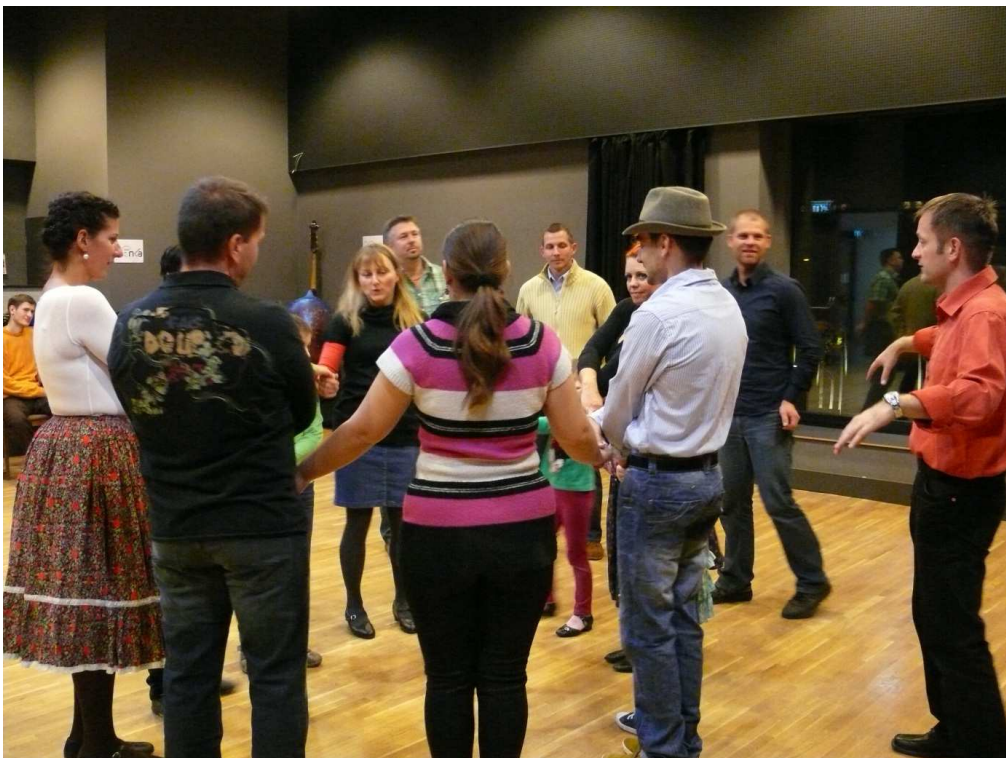
A felnőttek tánca nő irányításával.