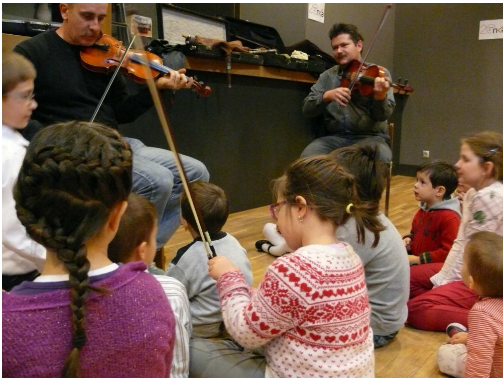
Másik alkalommal a hegedűvel és a vonóval.